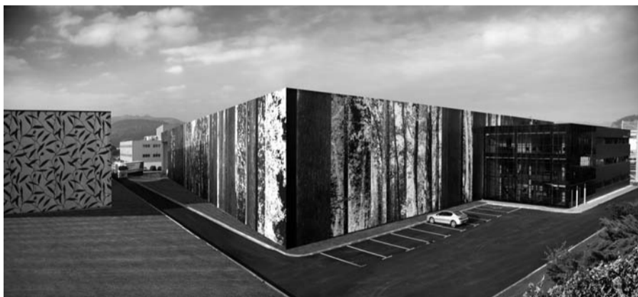
Imagen de la planta que Celulosas Vascas tiene en Boroa.